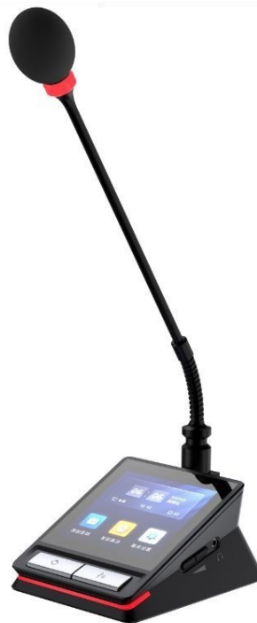
Рис. 1. Беспроводной пульт председателя цифровой конференц-системы с микрофоном типа «гусиная шея»