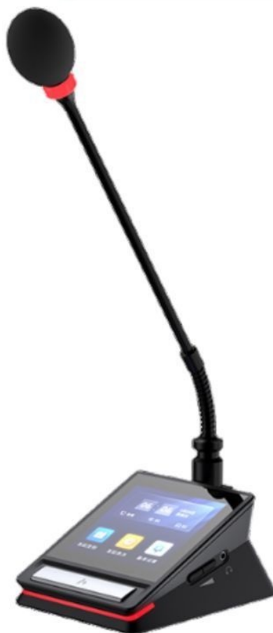
Рис. 1. Беспроводной пульт делегата цифровой конференц-системы с микрофоном типа «гусиная шея»