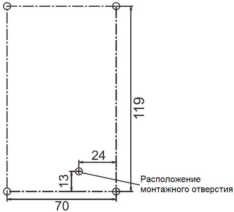
Схема установки Габаритные размеры в мм