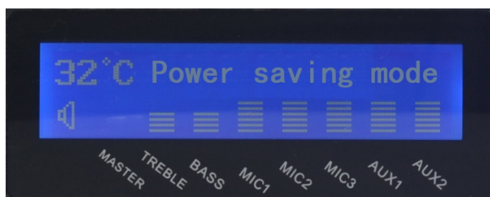
Рис.5.1. Начальный экран LPA-8508NASP35

Первоначальный экран имеет вид как на рис. 5.1: