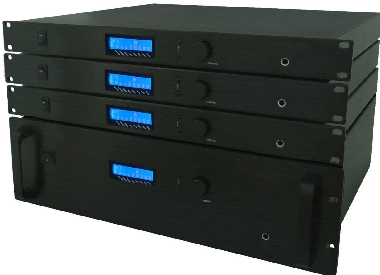
Рис. 2.1. Внешний вид усилителя мощности LPA-8508NASP35

Сетевой трансляционный IP усилитель предназначен для работы в составе системы диспетчерской и технологической связи и внутреннего интэркома LPA-IP. Усилитель управляется через программное обеспечение LPA-8500NAS и обеспечивает звуковую трансляцию на 1 линию 100В динамиков общей мощностью не более 350 Вт. Усилитель оснащен источником питания, интерфейсом входа, интерфейсом выхода, сетевым интерфейсом типа RJ45, и прочими разъемами.