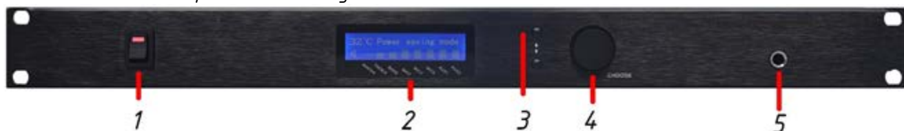
Рис.2.2. Передняя панель усилителя мощности LPA-8508NASP35