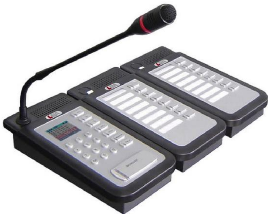
Рис.3.3. Общий вид LPA-8502L со станцией LPA-8502NAS