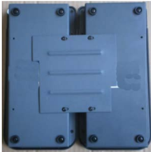
Рис.3.2. Схема крепления LPA-8502L

После подключения нужно закрепить модуль расширения с блоком LPA-8502NAS или другим блоком расширения с помощью монтажного комплекта (входит в комплект поставки)